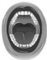
Situatie na operatie