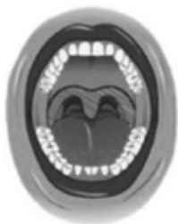
Situatie vóór operatie

Omdat het Maasstad Ziekenhuis een opleidingsziekenhuis is, is het mogelijk dat een arts in opleiding mee opereert. Als u hier bezwaar tegen heeft, kunt u dit vooraf aangeven aan de behandeld arts.