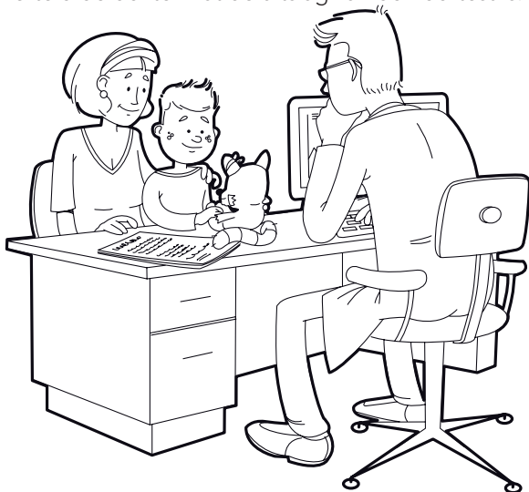
Illustraties: Nick van Oosten

Mike is klaar en de zuster print de test uit, ze brengt Mike terug naar mama in de wachtkamer en geeft de uitslag aan de KNO-dokter. Daarna worden mama en Mike weer even binnen geroepen en verteld de dokter wat de uitslag van de hoortest is.