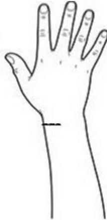
Het litteken na de operatie

De peesschede van twee pezen naar de duim is ontstoken, hetgeen erg pijnlijk kan zijn (omcirkelde gebied in bovenstaande tekening). Bij een operatie wordt de peesschede gekliefd zodat de pezen weer tot rust kunnen komen.