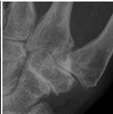
Röntgenfoto waarbij beginnende slijtage en een verzakking van het CMC1 gewricht en slijtgage van het STT gewricht is te zien