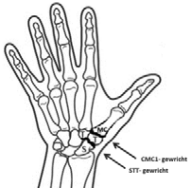
Plaatsen in het duimbasis en/of polsbotgewricht waar slijtage (dikgedrukt) kan optreden

Het versleten handwortelbeentje wordt verwijderd. Een peesstrip van een van de polsbuigers wordt op een bepaalde manier ingevlochten om de duim weer stabiliteit te geven. Aan de palmzijde zullen twee littekens zichtbaar zijn (de stippellijn).