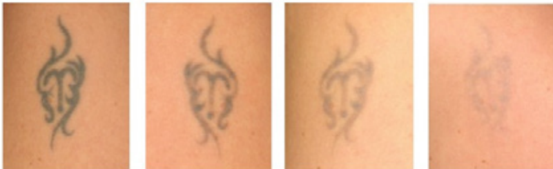
Voor de behandeling Na 3 behandelingen Na 5 behandelingen Na 7 behandelingen

Het resultaat is afhankelijk van verschillende factoren. Het is gebleken dat de kleur van de inkt bepalend kan zijn voor de hoeveelheid behandelingen die nodig zijn, omdat de ene kleur makkelijker te verwijderen is dan de andere. Daarbij zijn oppervlakkige tattoos beter te behandelen dan diep in de huid aangebrachte tatoeages. Ook oudere tattoos zijn makkelijker te behandelen en hebben minder laserbehandelingen nodig voor totale verwijdering. Daarbij kan het huidtype ook bepalend zijn voor het resultaat: donkere huidtypes kunnen moeilijker te behandelen zijn dan lichte huidtypes, vanwege huidreactie op de laser.