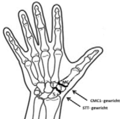
Plaatsen in het duimbasis en/of polsbotgewricht waar slijtage (dikgedrukt) kan optreden

Het versleten handwortelbeentje wordt verwijderd. Een peesstrip van een van de polsbuigers wordt op een bepaalde manier ingevlochten om de duim weer stabiliteit te geven. Aan de palmzijde zullen twee littekens zichtbaar zijn (de stippellijn).