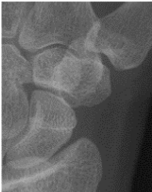
Röntgenfoto van een normaal duimbasis en polsbotgewricht

U bespreekt uw klachtenpatroon met de arts en een lichamelijk onderzoek wordt uitgevoerd. In geval van verdenking op een duimbasis en/of polsbotstijtage wordt een röntgenfoto gemaakt. Soms is aanvullend onderzoek nodig in de vorm van een CT scan.