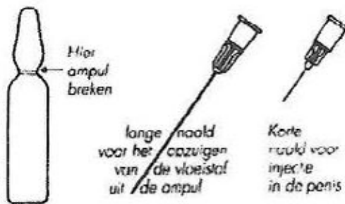
Gereedmaken van de injectiespuit

Het gereedmaken van de spuit en het injecteren dient bij voldoende licht uitgevoerd te worden. Neemt u de tijd voor deze handelingen. Let op een goede hygiëne, was uw handen en de penis goed met zeep voordat u gaat injecteren. Voer onderstaande procedure alleen uit indien deze duidelijk uitgelegd en voorgedaan is door uw arts.