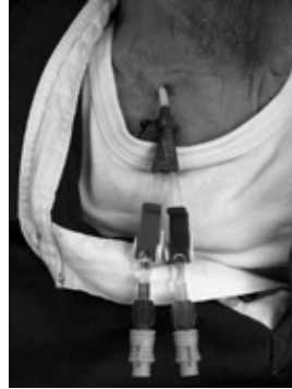
Afbeelding 4: dialysekatheter, dubbellumen

Wanneer er eerder of zelfs acuut gestart moet worden met de dialysebehandeling wordt er onder plaatselijke verdoving een dialysekatheter (een kunststof slangetje) ingebracht. Deze katheter wordt in de hals of lies in een groot bloedvat ingebracht en kan direct worden gebruikt. De dialysekatheter is een tijdelijke oplossing. Hij vormt een 'open' verbinding met de bloedbaan en is om die reden infectiegevoelig.