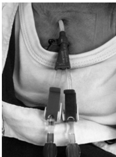
Ongetunnelde katheter met hechtingen

Een ongetunnelde katheter ligt enkele centimeters onder de huid en gaat daarna de ader in. De insteekopening (de opening waar de katheter door de huid naar binnen gaat) bevindt zich in de hals of lies. De katheter moet altijd vastgehecht zijn en de insteekopening wordt tijdens elke dialyse afgeplakt met een steriele pleister. Deze katheter is voor tijdelijk gebruik.