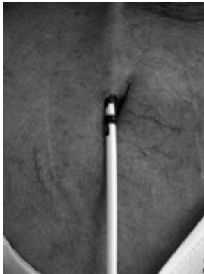
Getunnelde katheter

Na ongeveer 6 weken controleert de nefroloog of de katheter goed is ingegroeid en kunnen de hechtingen verwijderd worden. De bedoeling is dat deze katheter voor een langere periode gebruikt wordt. Bijvoorbeeld als er geen mogelijkheid is om een shunt aan te leggen of wanneer de patiënt ervoor kiest om geen shunt aan te laten leggen en dit besproken heeft met de nefroloog.