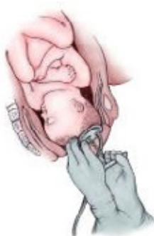
Uitdrijving met vacuumpomp