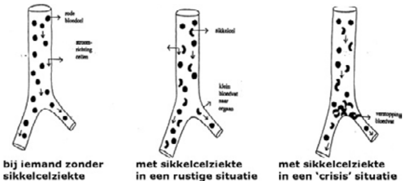
Figuur 2: Het verloop van het sikkelen in een bloedvatje

Als afbraakproduct van het hemoglobine-eiwit komt er een gele kleurstof (bilirubine) vrij, die een gele verkleuring van de huid en de ogen veroorzaakt. Deze verkleuring wordt geelzucht genoemd. Niet alleen worden door hun bijzondere vorm de rode bloedcellen sneller afgebroken, ze hebben door hun sikkelvorm ook de neiging gemakkelijk in elkaar te haken. Dit veroorzaakt het ontstaan van propfen in de bloedvaten, het "sikkelen" (figuur 2).