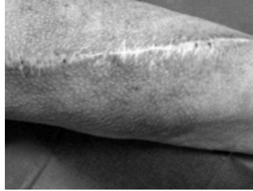
Afbeelding 3: shunt (bron Maasstad Ziekenhuis)

Een shunt is een kunstmatige verbinding tussen een slagader en een ader. Zo stroomt het bloed van de slagader naar de ader waardoor er in de ader een verhoogde druk ontstaat. Door de verhoogde druk zet de ader op. Hierdoor is het bloedvat makkelijker aan te prikken voor de hemodialyse.