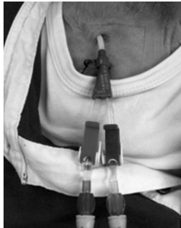
Afbeelding 4: dialysekatheter, dubbellumen

Wanneer er eerder of zelfs acuut gestart moet worden met de dialysebehandeling wordt er onder plaatselijke verdoving een dialysekatheter (een kunststof slangetje) ingebracht. Deze katheter wordt in de hals of lies in een groot bloedvat ingebracht en kan direct worden gebruikt. De dialysekatheter is een tijdelijke oplossing. Hij vormt een 'open' verbinding met de bloedbaan en is om die reden infectiegevoelig.