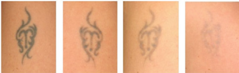
Voor de behandeling

Het resultaat is afhankelijk van verschillende factoren. Het is gebleken dat de kleur van de inkt bepalend kan zijn voor de hoeveelheid behandelingen die nodig zijn, omdat de ene kleur makkelijker te verwijderen is dan de andere. Daarbij zijn oppervlakkige tattoos beter te behandelen dan diep in de huid aangebrachte tatoeages. Ook oudere tattoos zijn makkelijker te behandelen en hebben minder laserbehandelingen nodig voor totale verwijdering. Daarbij kan het huidtype ook bepalend zijn voor het resultaat: donkere huidtypes kunnen moeilijker te behandelen zijn dan lichte huidtypes, vanwege huidreactie op de laser.