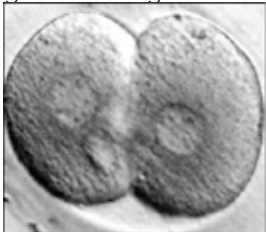
Embryo op 2-cellig stadium

De bevruchte eicellen worden in een nieuwe druppel kweekvloeistof gebracht en gedurende drie dagen op kweek gezet.