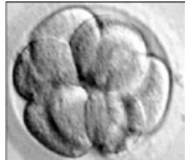
Embryo op 8-cellig stadium