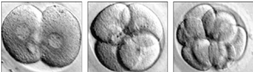
Embryo op 2-cellig stadium / Embryo op 4-cellig stadium / Embryo op 8-cellig stadium

De bevruchte eicellen worden in een nieuwe druppel kweekvloeistof gebracht en gedurende drie tot 5 dagen op kweek gezet.