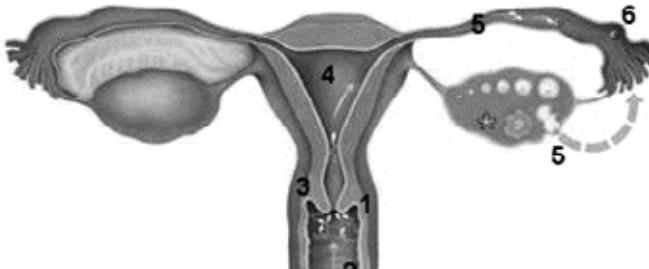
Figuur 1: Zaadcellen (1) via de vagina (2), baarmoedermond (3) en baarmoederholte (4) komen in de eileider (5) terecht en kunnen daar de eicel (6), die is vrijgekomen uit de eierstok, bevruchten

Intra-uteriene inseminatie (IUI) is het inbrengen (insemineren) van zaadcellen direct in de baarmoeder (intra-uterien). In de normale situatie komt na een zaadlozing in de vagina het sperma met de zaadcellen in de buurt van de baarmoedermond. Via het slijm van de baarmoedermond komen de zaadcellen via de baarmoederholte in de eileiders, waar de bevruchting van een eicel kan plaatsvinden (figuur 1).